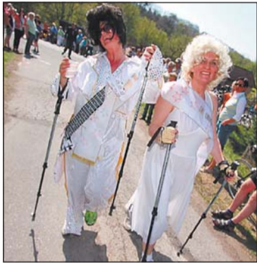
Im Elvis-Kostüm fanden diese beiden Sportler gestern den Weg zur Sparrenburg.