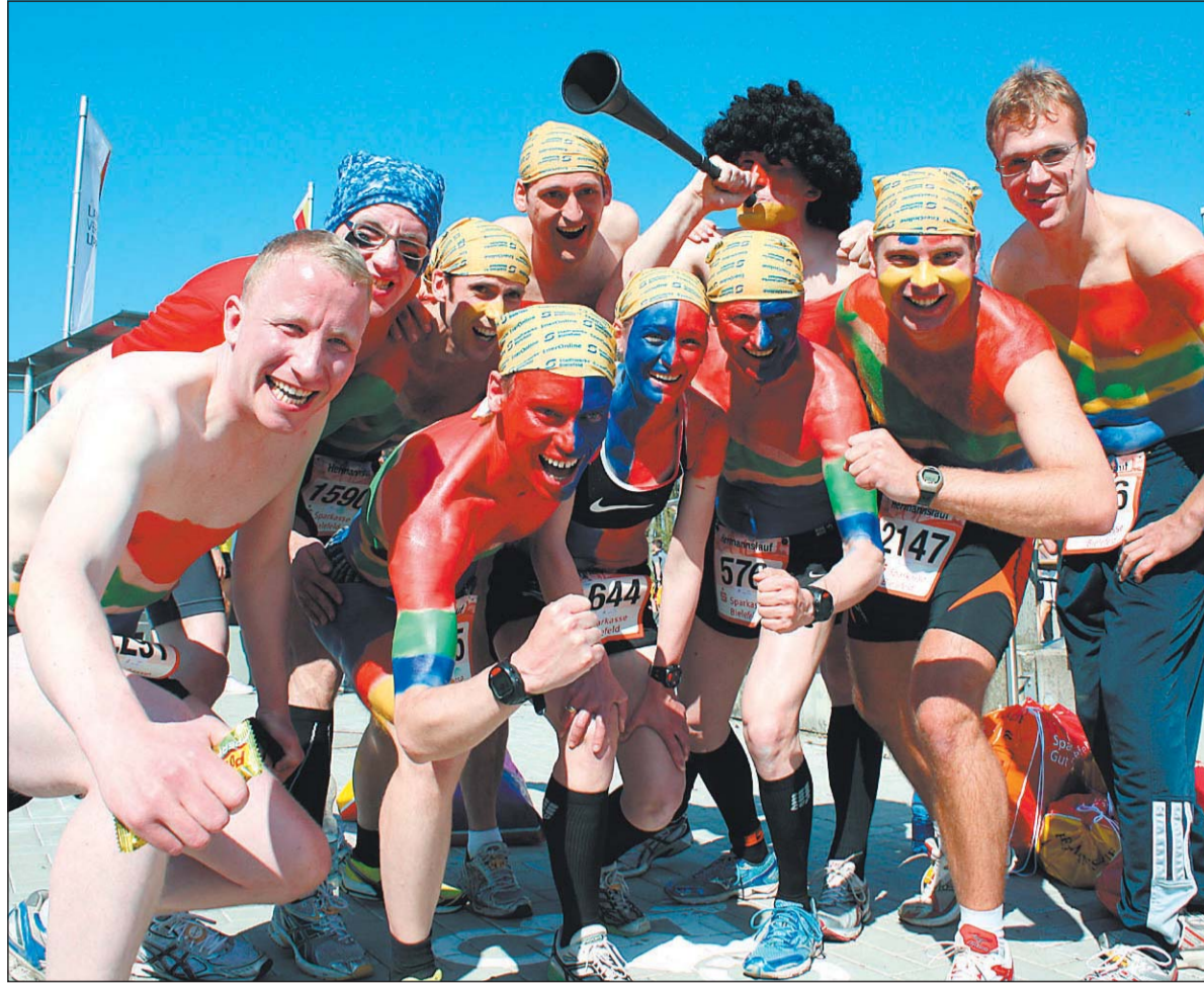
Seit nunmehr zehn Jahren immer wieder gern gesehene Gäste beim Hermannslauf: Die bunte Crew des TV Georgsmarienhütte hatte sich gestern die Fußball-WM zum Motto genommen und lief in den Nationalfarben Südafrikas (unten von links):