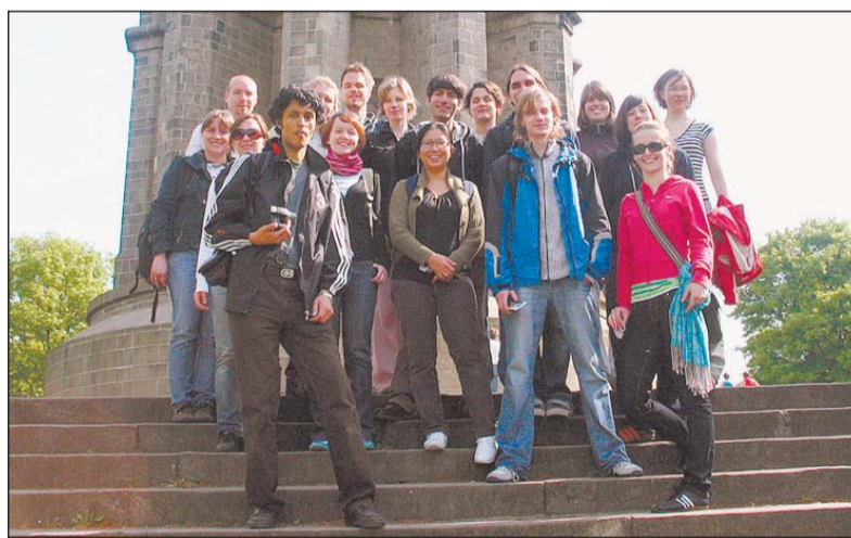
Ausländische Studenten der Uni Bielefeld besichtigten am Tag des Hermannslaufes das Denkmal bei Detmold.