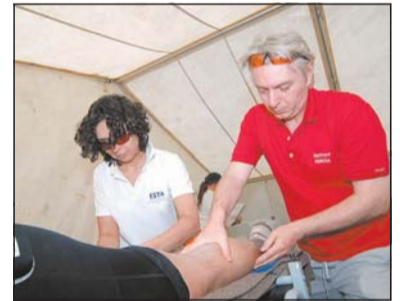
Müde Waden brauchen Pflege. Viele Physiotherapeuten kümmerten sich um die geschafften Läufer.