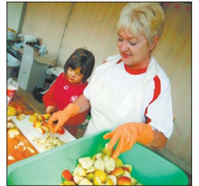
Große und kleine Helfer schnippeln fleißig kleine Apfelstücke, die die Läufer im Ziel bekommen.